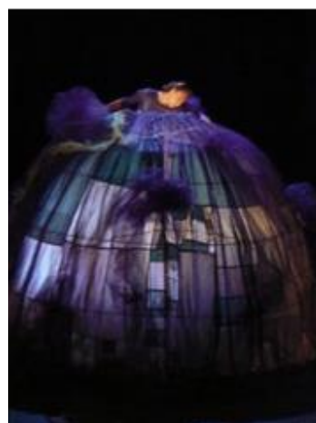
Un petit tour et puis revient ...