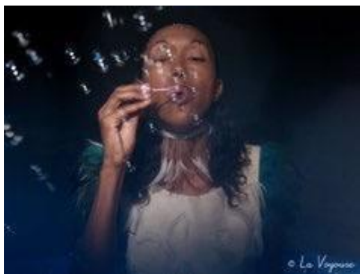
Les ruisseaux font du pédalo