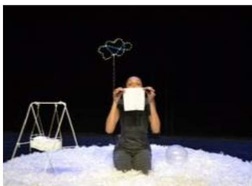
Il ne faut pas déranger les anges