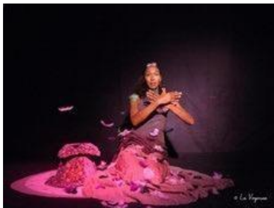
Sur le dos d'une souris